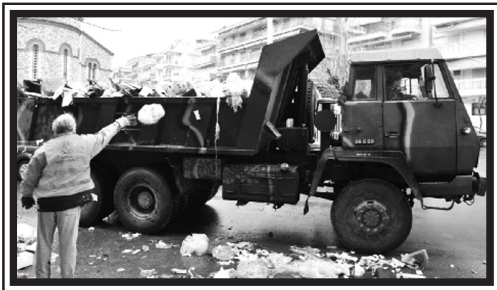
Οκτώβριος 2011, Θεσσαλονίκη. Ο στρατός ως απεργοδοσιαστικός μηχανισμός κατά τη διάρκεια των κινητοποιήσεων της ΠΟΕ-ΟΤΑ.