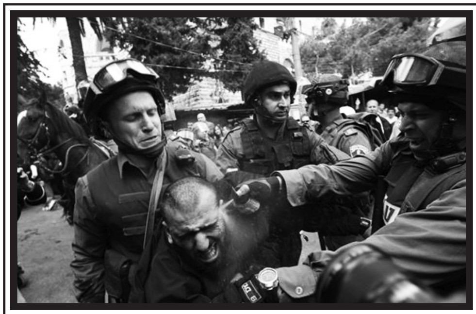
Συνοριοφύλακες της ισραηλινής αστυνομίας επιτίθενται με σπρέι πιπεριού εναντίον Παλαιστίνιου διαδηλωτή.