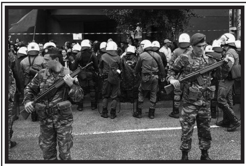
Οκτώβριος 2012. Η 71η Αερομεταφερόμενη Ταξιαρχία παύσα στη στρατιωτική παρέλαση της Θεσσαλονίκης.